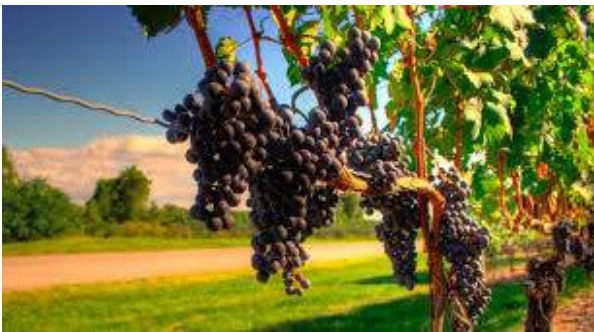
Vrugu i Rrushit