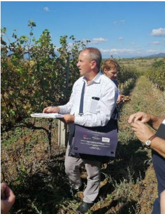
Vlerësuesi i Dëmeve

Vlerësuesi i dëmeve duhet të shqyrtojë hartat e fushave dhe të përcaktojë rrugën optimale për lëvizjet e tij. Kjo procedurë do të lejonte shqyrtimin e të gjitha pjesëve të dëmtuara për përcaktimin e dëmeve brenda periudhës më të shkurtër. Rekomandohet të merrni fotografi gjatë vlerësimit të dëmeve duke treguar përfshirjen e fermerit dhe vlerësuesit të dëmeve.