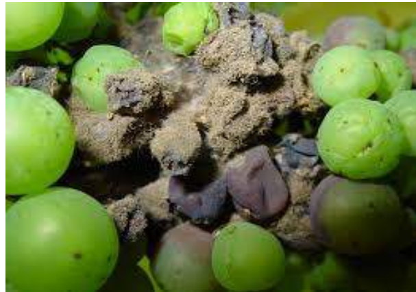
Kalbëzimi i kokrave të rrushit