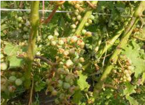
Dëmtimi i vreshtit nga breshëri

Sëmundja e njohur si Kalbëzimi (Botritisi) shfaqet gjatë motit të lagësht, sidomos pas breshërit, të shkakuar nga kërpudha nekrotrofike “ Botrytis Cinerea ” që shfaqet në vreshta menjëherë pas stuhisë së breshërit. Kokrrat e rrushit janë veçanërisht të ndjeshme ndaj kësaj sëmundjeje. Në shumicën e rasteve kur breshëri godet vreshtin, sëmundja më e zakonshme që shfaqet në kokrrat e rrushit është kalbëzimi, sepse konsiderohet se sasia e lagështisë është shumë e lartë dhe pasiqë kokrrat e rrushit janë të dëmtuara nga breshëri, janë edhe më shumë të ekspozuara ndaj kësaj sëmundjeje. Fotografitë e mëposhtme tregojnë shenjat kryesore të kësaj sëmundjeje: