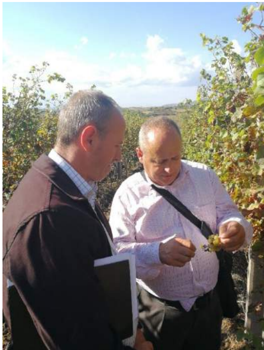
Vlerësuesi i Dëmeve dhe Fermeri